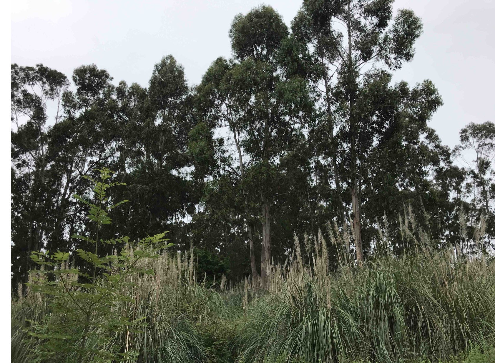
C_UNIDAD AMBIENTAL C_PRADOS DE SIEGA