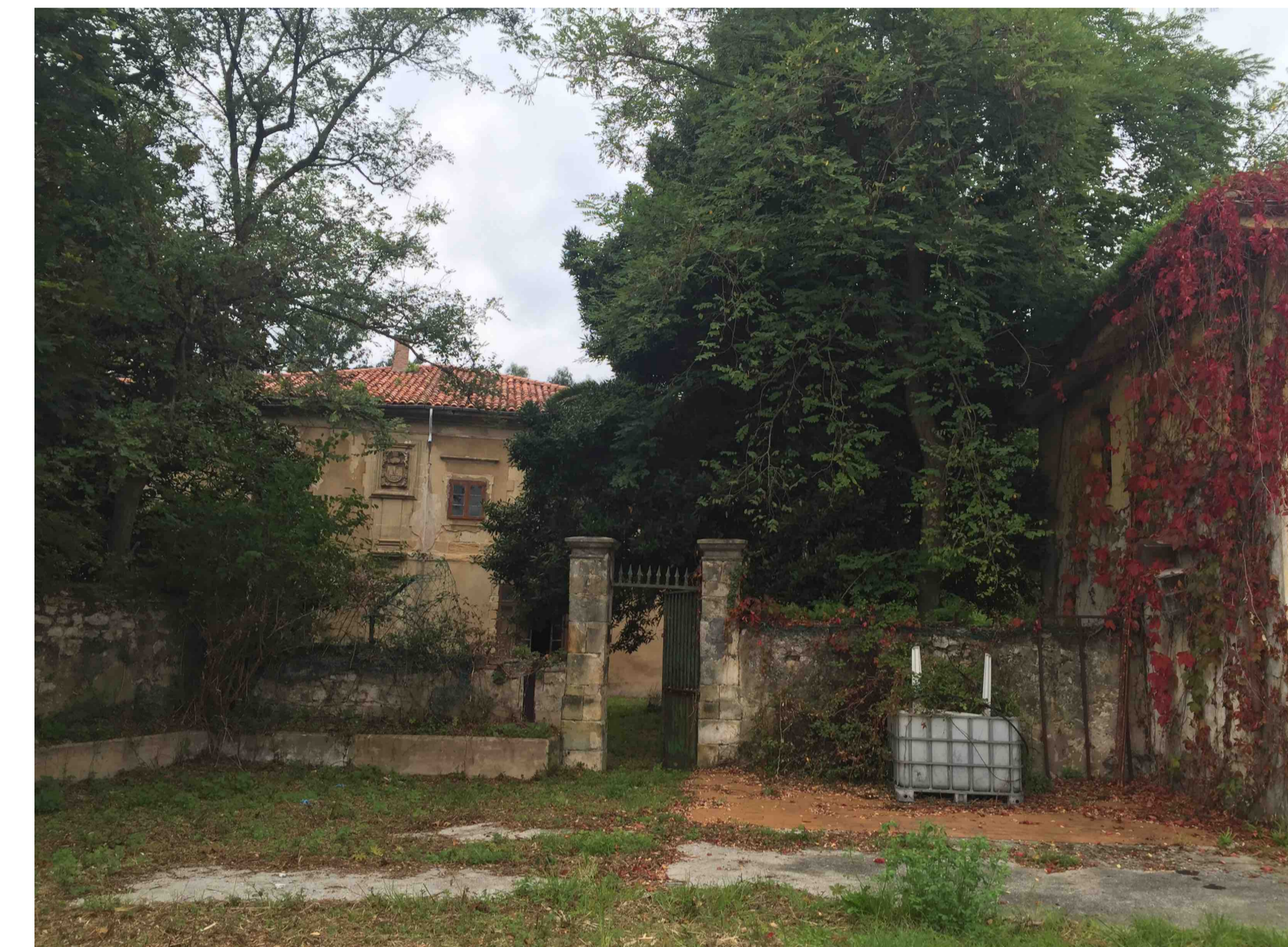
A_UNIDAD AMBIENTAL A_FINCA PALACIO EL SOMO